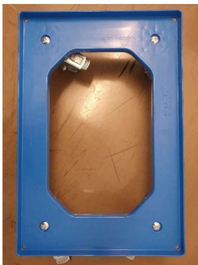
Transportroller RO 64 GU FE

2 x Mehrwegbehälter mit Deckel MBD 6442, 1 x Mehrwegbehälter MBD 6427, 1 x Transportroller RO 64 GU FE (Auer Packaging)