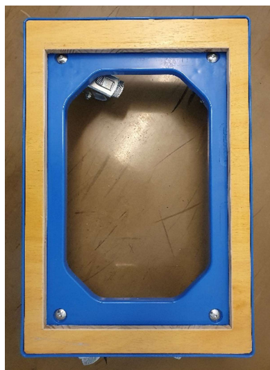
Transportroller mit Holz- Inlay